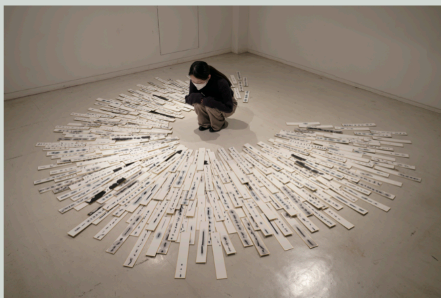
上原安深《書いて、滲んで、横んで、》

住所 / 〒220-0012 神奈川県横浜市西区みなとみらい 5-1 お問い合わせ / 電話 045-663-2812 / FAX 045-663-2813 開館時間 / 11:00-19:00 ◆電車でお越しの方 みなとみらい線「新高島駅」改札上 地下 1F より直結 横浜市営ブルーライン「高島町駅」2番出口より徒歩 10分