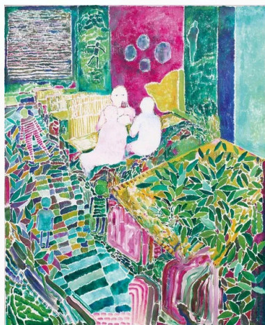
猫の見る風景 1600x1300mm キャンバスに油彩