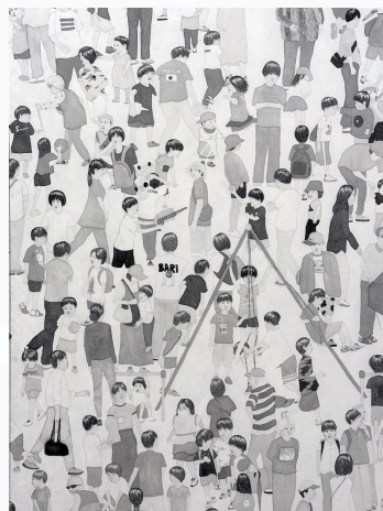
都会の公園を眺める(部分) 1167x4550mm 墨、高知麻紙、膠