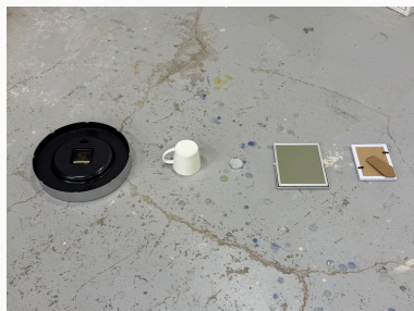
untitled 時計、カップ、方位磁針、鏡、フォト フレーム