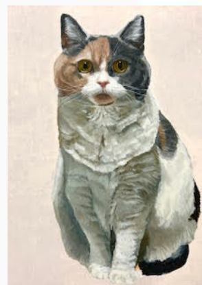
きなこ 910x652mm キャンバスに油彩