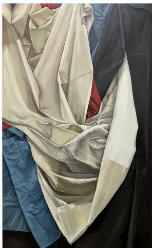
意識の表面 2103.4x1300mm キャンバスに油彩

和光大学表現学部芸術学科・栢田ゼミに関わりのある学生と教員による、生活空間や身体感覚、記憶や痕跡といった身近な経験を起点に、それぞれの視点で世界と向き合い、思考を可視化した作品を紹介します。スタジオでの制作と対話を通して育まれた表現が、いま公の場へと開かれます。