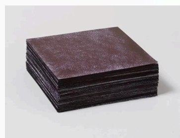
いつまでも上がることのない幕がそのス テップを決定させない 70x210x210mm 紙にボールペン