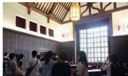
ポツダム会談が開かれたツェッティーリエンホーフ宮殿：ベルリン近郊