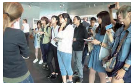
〈テロのトポグラフィ〉でナチスについての説明をきく：ベルリン