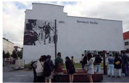
〈ベルリンの壁〉があったベルナウアー通り前