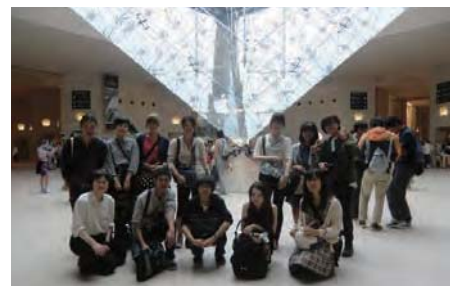
ルーヴル美術館・逆さピラミッド前で：パリ