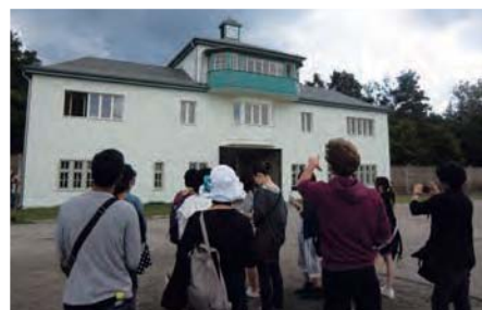
ザクセンハウゼン強制収容所：ベルリン北部