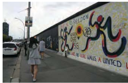
イーストサイド・ギャラリー：ベルリン