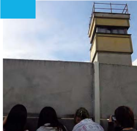
〈ベルリンの壁〉と監視塔

場所：ドイツ(ベルリン、ポツダム、ライプツィヒ)、フランス(パリ)、ポーランド(シュチェチン) 期間：2013年8月26日～9月9日 参加者：11名 担当：中力えり