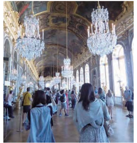
ヴェルサイユ宮殿 鏡の間：パリ近郊