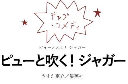
ジャグ・コメディ うすた京介／集英社

「ピヨ彦」と酒留清彦は、ギタリストを志望してオーディションを受けるなか、謎の笛吹き男・ジャグ・ジュンに出会う。彼は清彦の前にことごとく現れ、縦笛の魅力を語る。やがて2人は、怪しげなスター養成校の寮で共同生活を始める羽目になる。