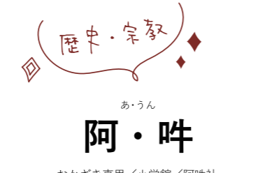
阿・吽 おかざき真里／小学館／阿吽社

弘法大師としても知られる高野山を築いた、空海。比叡山延暦寺の開祖、最澄。対照的な考えを持ちながらも平安時代に新風を吹き込むこととなる2人は、遣唐使として中国に渡ったのち、そこで学んだ最先端の思想を日本に根付かせようと奮闘する。