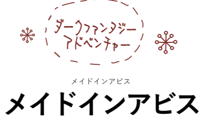
メイドインアビス つくしあきひと／竹書房

奇妙な生物たちが生息し、貴重な遺物が眠る巨大な縦穴「アビス」。不可思議に満ちたその姿は、人々を魅了し冒険心を掻き立てていた。アビスの縁に築かれた街に暮らす少女リコは、アビス探窟中に少年の姿をしたロボットを拾う。