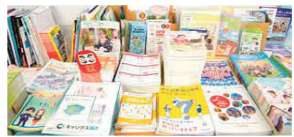
キャリア支援室には、就活に関する資料が所狭しと並びます。これを見に来るだけでも、訪れる価値あり!

活は難易度が上がります。ただ、私たち相談員は学生に対し「卒業後は絶対に就職をしてください」という話をするわけではなく、学生が進みたい進路について、客観的かつ社会人としてアドバイスしていきます。キャリア支援室は、あなたが思い描く将来を実現させるためには、今後どういうことが必要になってくるかを一緒に考える場なのです。