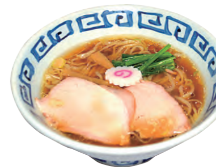
大人気の「中華そば」700円。「チャーシュー丼」400円や手包みワンタンの「ワンタン麺」900円もあります。