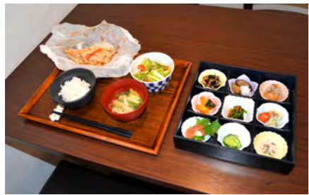
どれも美味しくお得感満載！「はるか御膳」1,200円。