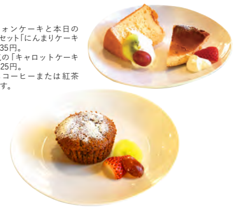
(上) シフォンケーキと本日のケーキのセット「にんまりケーキセット」935円。 (下) 人気の「キャロットケーキセット」825円。 どちらもコーヒーまたは紅茶が付きま。