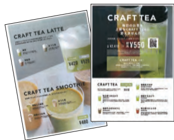
一級茶師が選抜いたお茶を楽しむ「CRAFT TEA」がスタート。サブスクで初月550円から気軽に始められます。