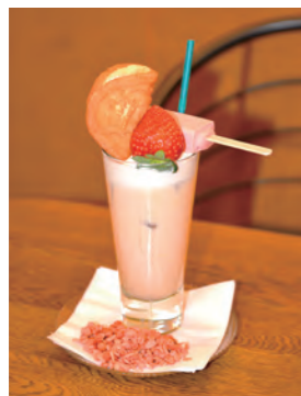
可愛さも満点で、茶葉と隠し風味のプリンダーが香る「ロイヤルミルクティー」大粒とちおとめ・いちごづくしホイップ」670円。