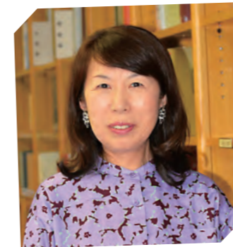
副学長 現代人間学部 心理教育学科