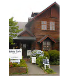
住宅街にある素敵なログハウス。季節の花々が迎えてくれます。