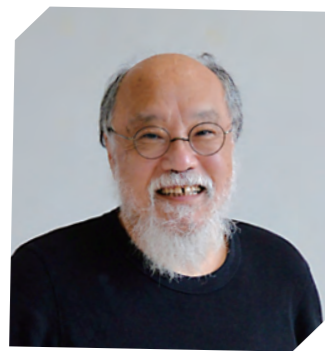
表現学部長 表現学部 総合文化学科