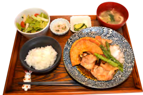
下処理から店内で行っているジューシーな揚げ鶏定食「揚げ出し鶏」1,000円。