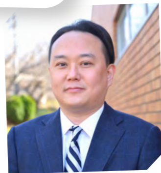
経済経営学部長 経済経営学部 経済学科