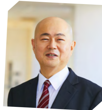
学長 経済経営学部 経済学科