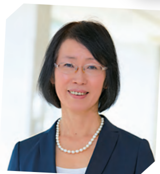
大学院 社会文化総合研究科委員長