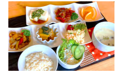
野菜をたっぷり使った、過替わりのランチ「シュルツプレート」1,100円。ドリンク付きは1,320円です。