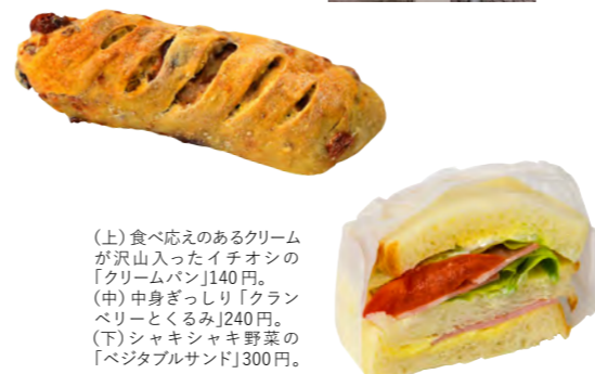
(上) 食べ応えのあるクリームが沢山入ったイチオシの「クリームパン」140円。 (中) 中身ぎっしり「グランベリーとくるみ」240円。 (下) シャキシャキ野菜の「ベジタブルサンド」300円。