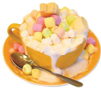
溢れるほどマシュマロたっぷり「マシュマロミルクティー」690円。