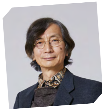
現代人間学部長 現代人間学部 人間科学科

ご入学おめでとうございます。 和光大学を代表して、 新入生の皆さんへお祝いの言葉を贈ります。