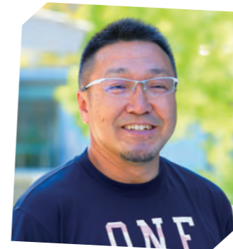
副学長 現代人間学部 人間科学科