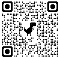
シミュレーターQRコード

(重要) 支援区分によっては本奨学金より修学支援新制度(日本学生支援機構給付奨学金・授業料等減免)の方が支援額が大き場合があります。支援額について比較検討の上、応募をお勧めします。日本学生支援機構給付奨学金の支援区分については下記のサイトでシミュレーションができます。シミュレーション結果は、入力された情報等を基に試算した結果によるものです。シミュレーション結果と実際の申込結果は異なる場合があります。