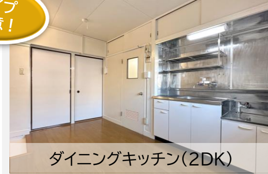
ダイニングキッチン(2DK)