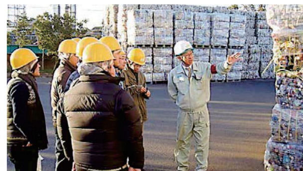
環境学フィールドワーク