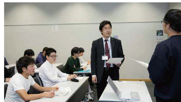
公共政策ゼミナール