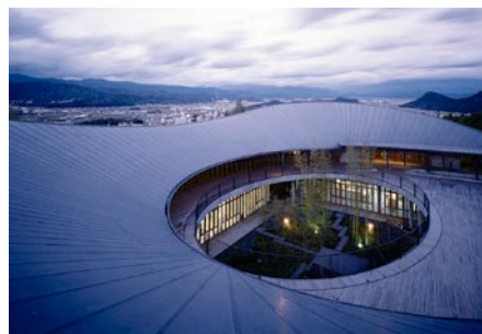
牧野富太郎記念館

ちひろ美術館（長野県北安曇郡）、牧野富太郎記念館（高知県高知市）、ちひろ美術館・東京（東京都練馬区）、みなとみらい線馬車道駅（神奈川県横浜市）、島根県芸術文化センター（島根県益田市）、とらや東京ミッドタウン店（東京都港区）、JR日向市駅（宮崎県日向市）など多分野に渡る。また近著には、2004年『建築的思考のゆくえ』王国社、2006年『建土築木1 構築物の風景』、『建土築木2 川のある風景』鹿島出版会などがある。